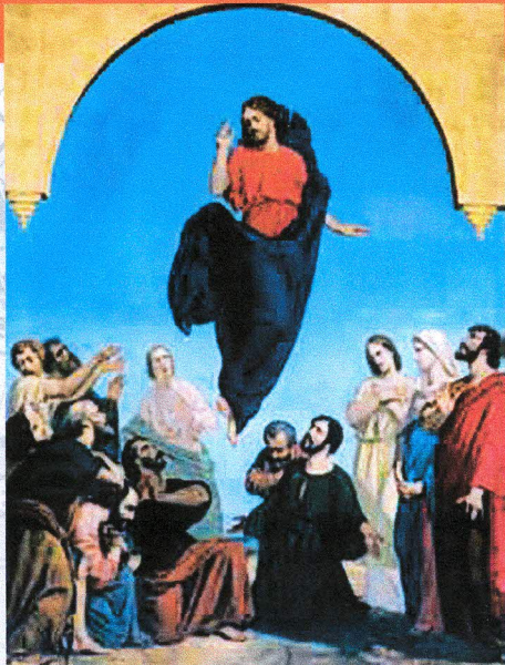
Ascension , par Viger Duvignau, huile sur toile, 1841. Les Genettes, église Saint-Martin.