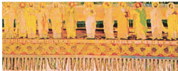
L'envoi des apôtres en mission , pièce murale, laine brodée du début du XX e siècle. Inscrit au titre des monuments historiques. Échauffour, église Saint-André.

Le récit de l'Ascension qui ouvre les Actes des apôtres comprend en outre l'annonce par le Christ de l'envoi aux disciples d'une force, l'Esprit-Saint, qui leur permettra d'accomplir leur mission.